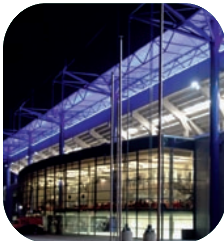
Die selbstreinigende Glasfassade vor der in der Vereinsfarbe beleuchteten Westtribüne.

Der Entwurf der Arena stammt von dem Dortmunder Architekturbüro ar.te.plan. Er kombiniert im Innenraum des Stadions eine stimungsfördernde Kompaktheit mit einem großzügigen Ambiente, das durch freie Sicht von allen Plätzen hervorgerufen wird. In das Gebäude vor der Westtribüne sind u. a. Logen, gastronomische Einrichtungen, ein Business-Bereich, der Fan-Shop und die Geschäftsstelle des MSV integriert. Die offene, gläserne Gestaltung des lichtdurchfluteten Foyers dient als