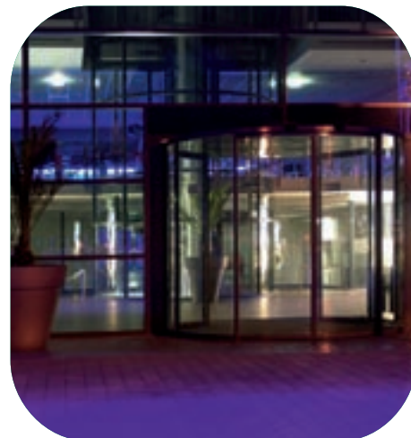
Durch eine Glasrehtür gelangen Besucher in das lichtdurchflutete Foyer, das ganzjährig geöffnet ist.

kommunikative Begegnungsfläche für die Besucher. Neben den für ein Stadion typischen Baustoffen Beton und Stahl spielt Glas als modernes Gestaltungsmittel eine wichtige Rolle. Dem Gebäude vorgelagert ist eine 120 Meter breite und 11 Meter hohe Glasfassade. Die insgesamt vier Ebenen des Hauptgebäudes verbindenden Aufzüge erlauben einen Blick in die darunter liegende großzügige Lobby.