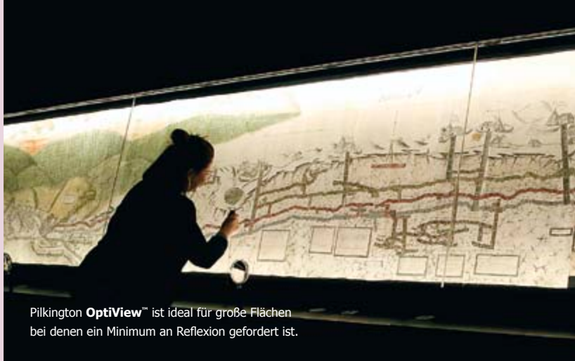
Pilkington OptiView™ ist ideal für große Flächen bei denen ein Minimum an Reflexion gefordert ist.

Mit Pilkington MirroView™ können Sie digitale Geräte anspruchsvoll und individuell in Ihre Galerie oder Ihr Museum integrieren, denn die Beschichtung von Pilkington MirroView™ ist mit Touchscreen-Technologien kompatibel. Dabei überzeugt das Produkt durch eine besonders widerstandsfähige, farbneutrale und reflektierende Beschichtung und lässt sich nach spezifischen Bedürfnissen vielfach weiterverarbeiten.