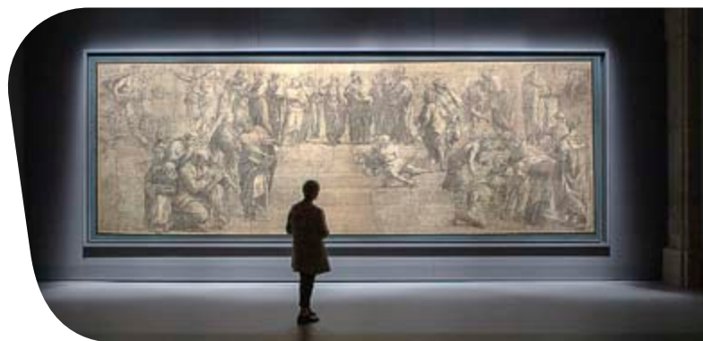
Eine 30 m 2 Scheibe Pilkington OptiView™ OW – Die Schule von Athen (Raphael), Mailand, Italien

Pilkington OptiView™ ist ideal geeignet für Panoramascheiben und Vitrinen und für alle weiteren Anwendungen, bei denen das unmittelbare Sehen und Erleben von Kunst wesentlich ist.