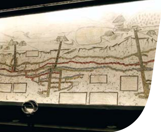
Pilkington OptiView™ Ultra Protect – Flach'scher Riss, Deutsches Bergbaumuseum, Bochum