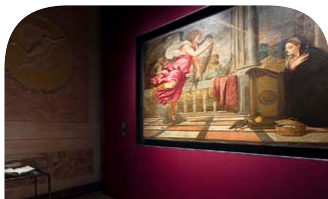
Pilkington OptiView™ Protect OW – Ausstellung Tiziano Richter im Palazzo Te, Italien