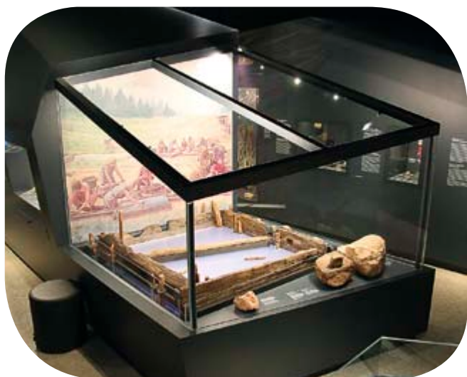
Vitrine mit dem extraklaren Pilkington Optiwhite™ , Deutsches Bergbaumuseum, Bochum