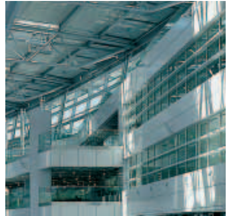
Innenfassade der Haupthalle: Die Verglasung erfolgte vollständig mit Pilkington Pyrostop.

Die große ungeteilte Haupthalle vermittelt auch im Innenraum das mit dem Fliegen verbundene Gefühl von Weite und Leichtigkeit.