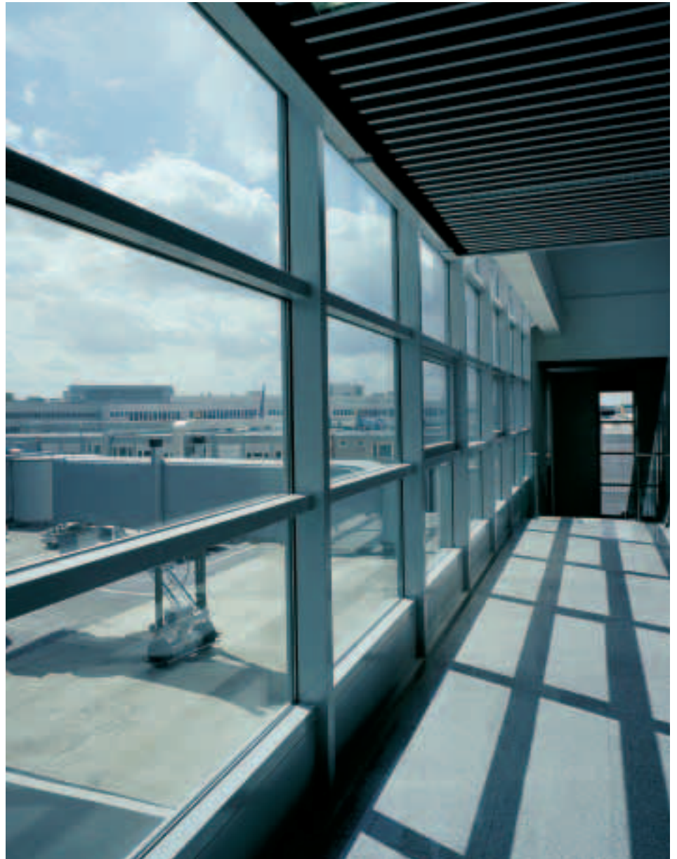
Verglasung der Fluggastbrücken mit Pilkington Optitherm SN: Kein dunkler Tunnel, sondern eine lichte Gangway, die den Fluggast an dem regen Treiben auf dem Gelände teilhaben lässt.

Funktionsglas-Kombinationen ermöglichten Transparenz auch dort, wo zusätzliche Anforderungen an Brand- und Schallschutz sowie an Sicherheit bestanden.