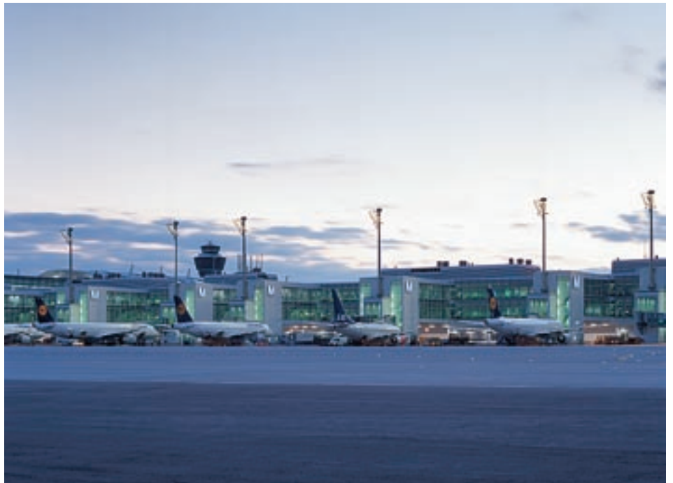
Blick von der Gepäcksortierhalle auf einen Teil der 24 Fluggastbrücken vor dem Piergebäude.

„Der Neubau des Terminal 2 bedeutet einen weiteren Schritt vom Flughafen in der Landschaft zur Stadtlandschaft Flughafen, der „Airport City.“