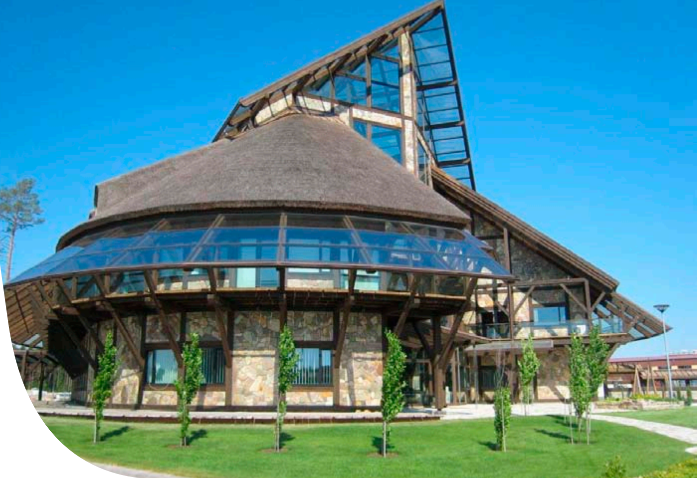
Biolan Oy pääkonttori, Eura.