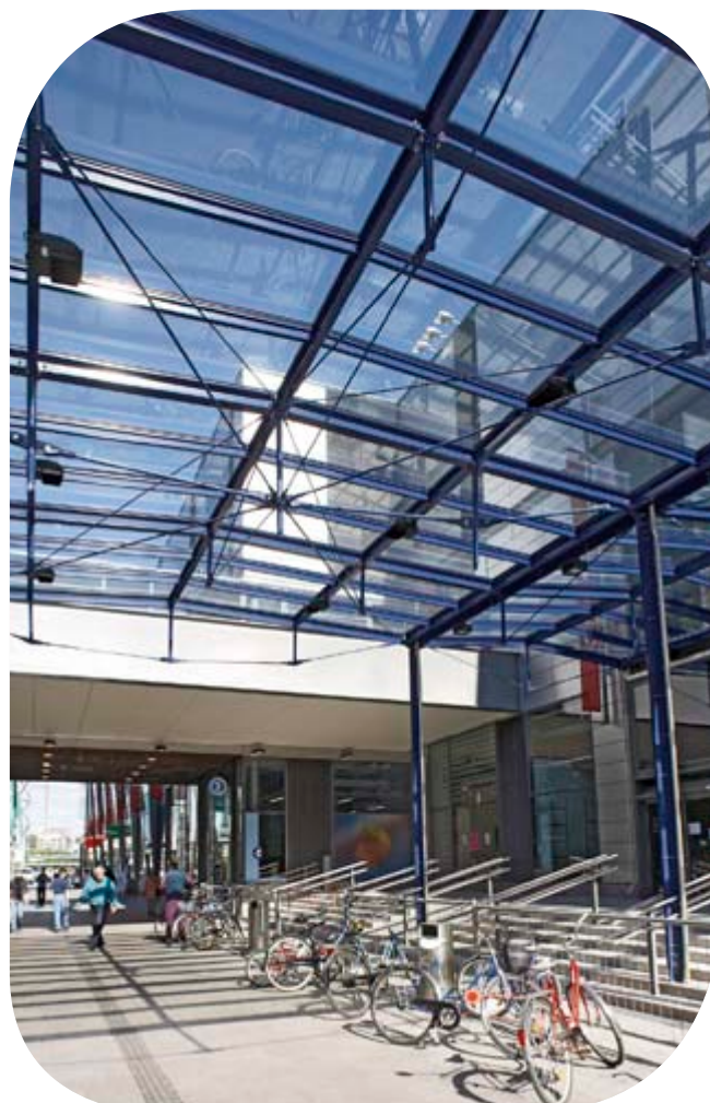
Kauppakeskus Sellon lasikate Espoon Leppävaarassa.

Pilkington Activ ™ ja sen itsepuhdistuvuus on yhdistettävissä lasituksen muihin tarpeisiin kuten auringonsuoja-, energiansäästö-, ääneneristysominaisuuksiin sekä turvalasiturvalasivaatimuksiin.