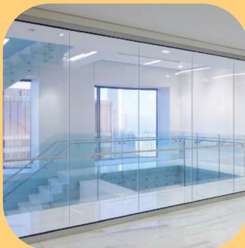
Pilkington Pyrostop ® Line: applicazione interna in un telaio acciaio.

I vetri sono installati in un telaio periferico fissato nel profilo. I vetri Pilkington Pyrostop ® Line sono sigillati l'un all'altro da un silicone appropriato associato a un nastro di fibra ceramica, formando una partizione vetrata continua, senza montante intermedio che può essere esteso su una larghezza infinita. Il sottile giunto verticale di spessore nominale di 5 mm è una caratteristica di Pilkington Pyrostop ® Line.