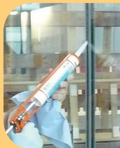
Installazione di una vetrata bordo a bordo con utilizzo di un giunto di silicone adatto e approvato associato a un nastro di fibra ceramica.