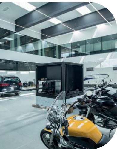
Partizione bordo a bordo realizzata con Pilkington Pyrostop® Line Triple, Sede di STEINBAUER.

Pilkington Pyrostop® Line Triple è stato progettato per partizioni interne resistenti al fuoco con prestazioni di isolamento termico, senza la necessità di ulteriori telai verticali. Offre una soluzione bordo a bordo (butt joints) estetica e sostenibile per architetti, progettisti, trasformatori e costruttori. Pilkington Pyrostop® Line Triple è composto da una lastra di Pilkington Pyrostop® inserita in due lastre di vetro temprato combinati in un vetrocamera di spessore nominale di \geq 39 mm.