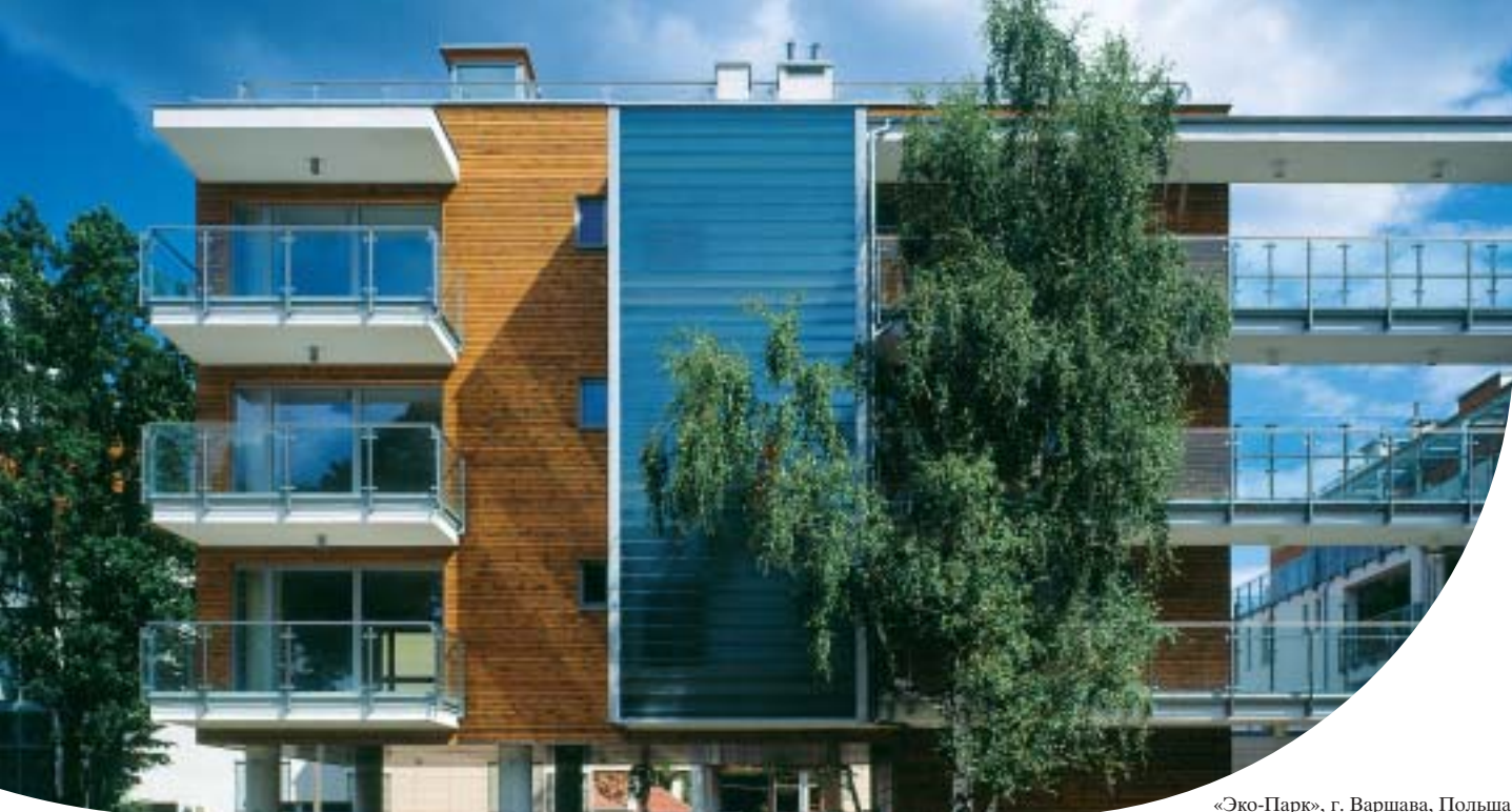
«Эко-Парк», г. Варшава, Польша