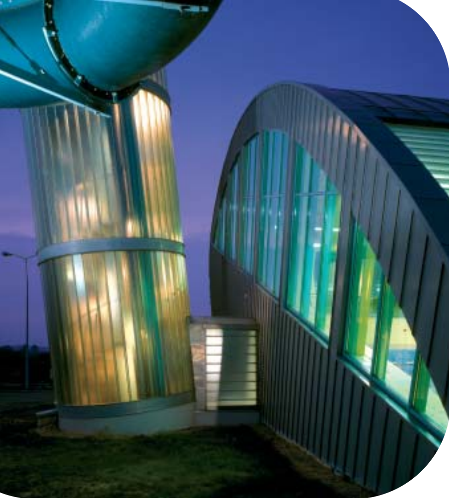
Городской центр спорта и рекреации, г. Ясло, Польша

низкоэмиссионному покрытию, стекло Pilkington Profilit™ Plus 1,7 удерживает тепло в здании. Оптимальная теплоизоляция приводит к снижению затрат на энергию. При двойном остеклении профильное стекло с низкоэмиссионным покрытием должно быть установлено изнутри. Из-за ярко выраженной радужной окраски низкоэмиссионного покрытия, рекомендуется устанавливать снаружи профильное стекло с цветным покрытием, например, Pilkington Profilit™ Amethyst, которое нейтрализует цвет низкоэмиссионного покрытия.