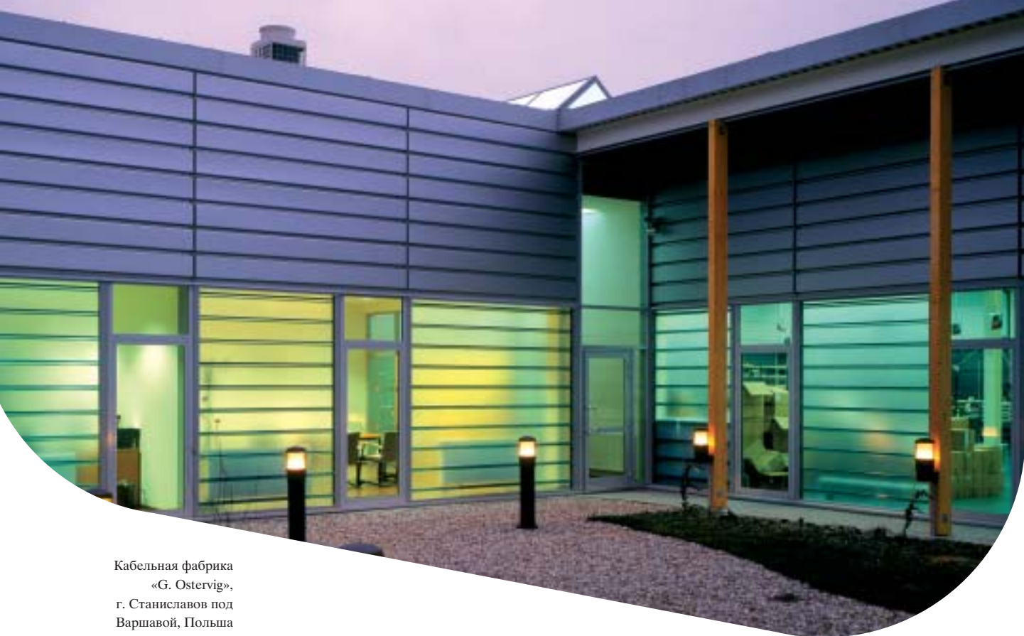
Кабельная фабрика «G. Ostervig», г. Станислав под Варшавой, Польша