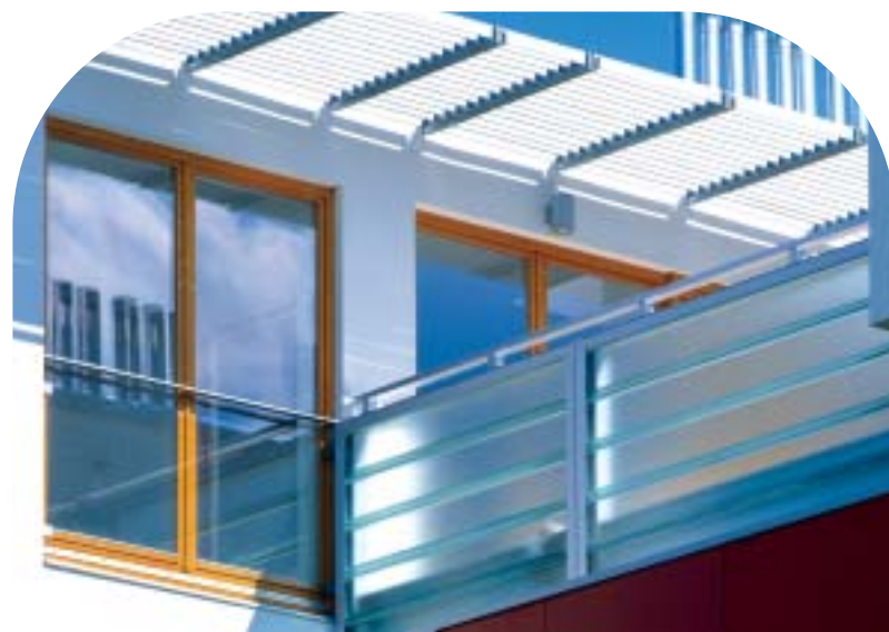
«Эко-Парк Cameratta», г. Варшава, Польша

Оригинальный внешний вид системы, тем не менее, не означает ее высокой цены. Система Pilkington Profilit™ является экономичной в применении, а ее монтаж осуществляется быстро и несложно.