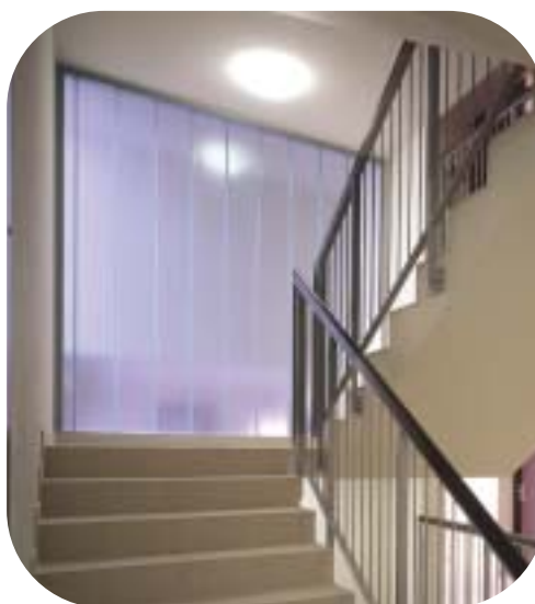
Микрорайон «Marina Mokotów», г. Варшава, Польша

Внешние алюминиевые рамы доступны в различном исполнении, например, анодированные или с порошковым покрытием в стандартной цветовой гамме (RAL). Разнообразие доступной цветовой гаммы позволяет архитекторам и проектировщикам применять рамы в качестве дополнения или для того, чтобы подчеркнуть внешний вид стеклянных элементов.