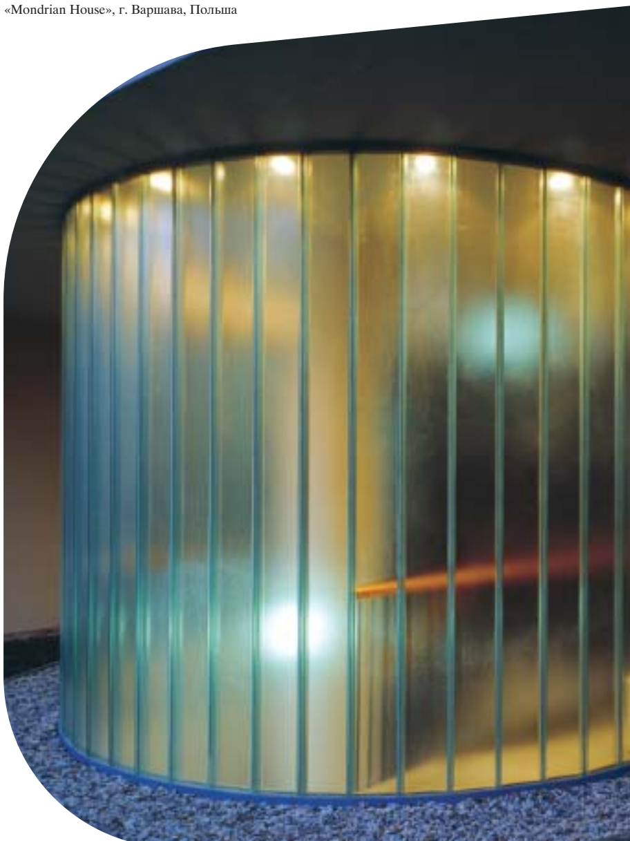
«Mondrian House», г. Варшава, Польша