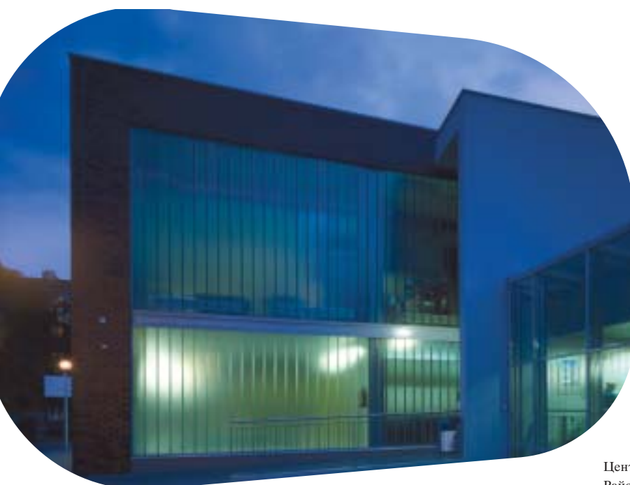
Центр спорта и рекреации, Район «Ochota», г. Варшава, Польша

Стекло Pilkington Profilit™ Plus 1,7 было разработано специально для обеспечения соответствующей теплоизоляции. Однако необходимым условием является применение специальных теплоизолированных рам. Стекло использует солнечную энергию в качестве пассивного источника тепловой энергии, а, кроме того, благодаря