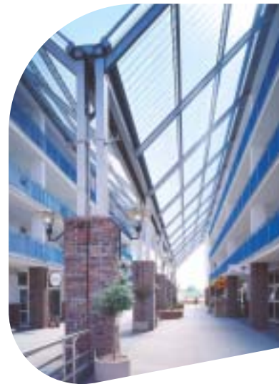
Торговый пассаж, г. Тыхы, Польша

В ответ на все чаще появляющиеся требования, касающиеся высокого уровня светопропускания и одновременно наличия защиты от шума, теплоизоляции и солнцезащиты, Pilkington предлагает интересные решения, как с архитектурной, так и с экономической точки зрения - остекление с применением системы Pilkington Profilit ™ . Остекление крыш без дополнительных конструктивных элементов отвечает всем необходимым требованиям как в области безопасности, так и эстетики зданий. Как правило, для остекления крыш применяется профильное стекло, армированное проволокой. Это не оказывает отрицательного влияния на внешний вид, и в то же время отвечает требованиям по безопасности (согласно норме DIN 18361).