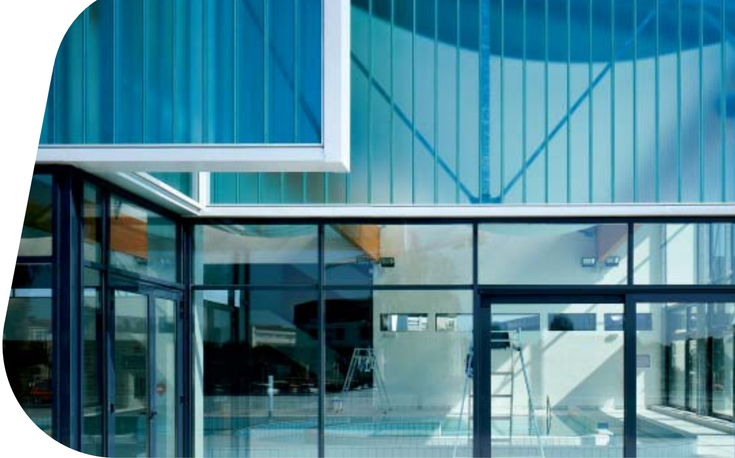
Бассейн, г. Сен-Дизье, Франция