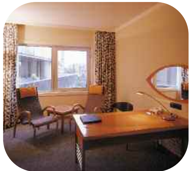
Стационарное остекление в отеле «Radisson SAS» в Варшаве – Pilkington Pyrostop™ 60-351.