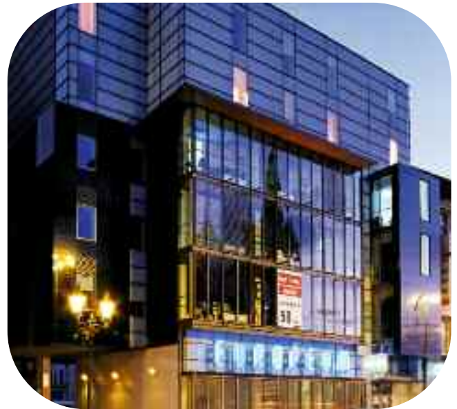
Остекление фасада в здании фонда «Krzyżowa» во Вроцлаве – Pilkington Pyrostop™ 30-18.