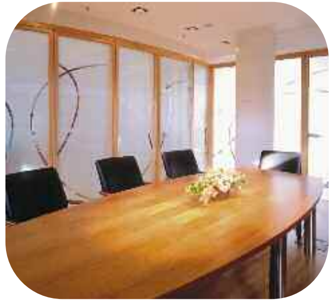
Деревянные простенки в офисном здании «Focus» в Варшаве – Pilkington Pyrostop™ 30-201, пескоструйная обработка стекла.