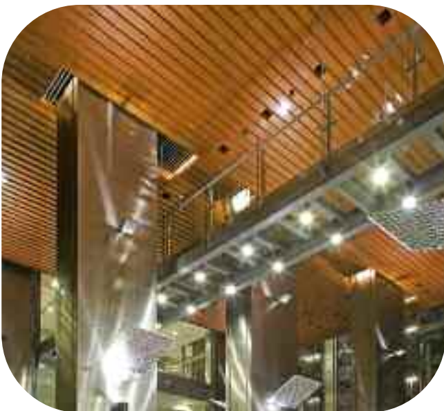
Пешеходные мостики в классе EI 60 в офисном здании «Rondo 1» в Варшаве – Pilkington Pyrostop™ 60-50.