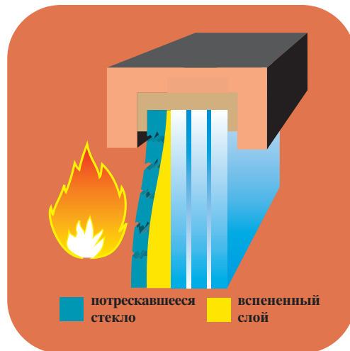
Поведение стекла Pilkington Pyrostop™ и Pilkington Pyrodur™ под воздействием огня

Необходимым было введение нового продукта, который выдержит температуры типичного пожара порядка 1000°C и вдобавок защитит эвакуирующихся людей от опасного воздействия теплового излучения. Такими продуктами являются Pilkington Pyrostop™ и Pilkington Pyrodur™.