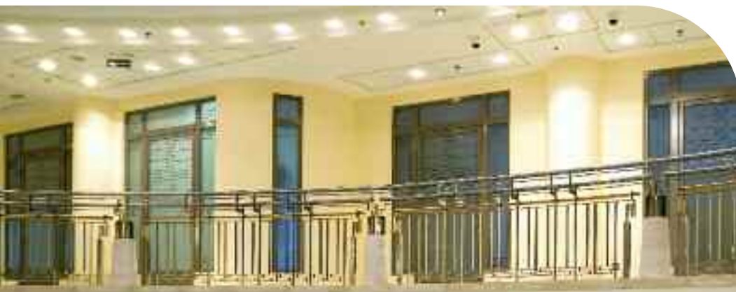
Остекления дверей и перегородок в офисном здании «Zertex» в Варшаве выполнено из стекла пескоструйной обработки Pilkington Pyrostop™ 30-10.

Способность системы задерживать пламя, дым и горючие газы в течение времени, определенного в классификации. С не нагреваемой стороны не может появиться пламя более, чем на 10 секунд.