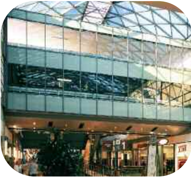
Фасад прикрывающий проезд для автомобилей в торговом центре «Promenada» в Варшаве – Pilkington Pyrostop™ 30-10.