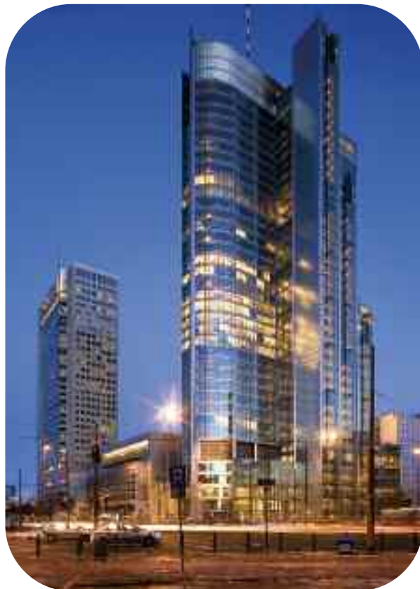
Для остекления пешеходного мостика в офисном здании «Rondo 1» в Варшаве было использовано стекло Pilkington Pyrostop ™ 60-50.

Подробная информация предоставляется на запрос клиента.