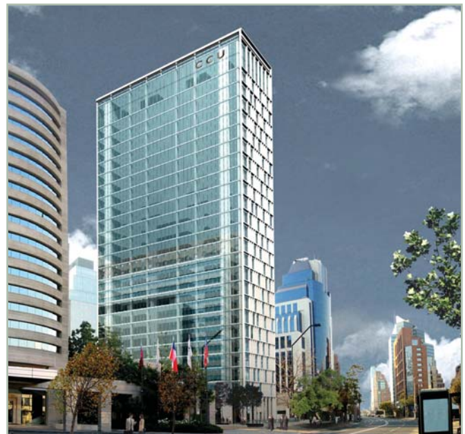
Obra: Edificio CCU

Arquitecto: Flaño, Nuñez, Tuca Arquitectos; ADN Arquitectura y diseño; + arquitectos.