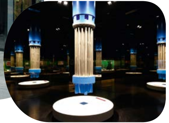
Glaskubus in der Dauerausstellung des Deutschen Bergbau-Museums in Bochum.