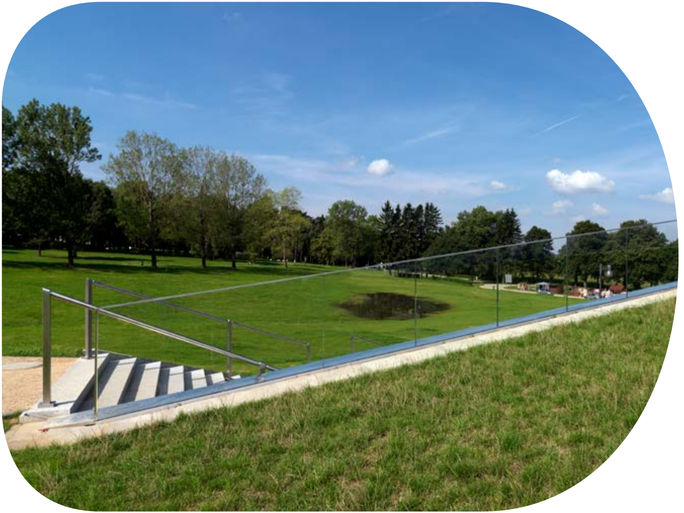
Grundwalddenkmal, Krakau, Polen.