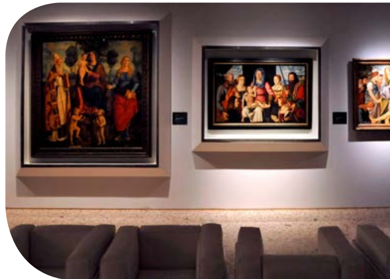
Bernadino Luini Ausstellung, Palazzo Reale, Mailand, Italien.

Pilkington OptiView™ ist ideal geeignet für Panoramascheiben, Gemäldeverglasungen und Vitrinen sowie für alle weiteren Anwendungen, bei denen das unmittelbare Sehen und Erleben von Kunst wesentlich ist.