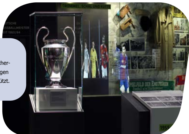
Deutsches Fußballmuseum, Dortmund.

Durch die Verarbeitung von Pilkington OptiView™ zu Verbundsicherheitsglas sind Ausstellungsstücke gegen Vandalismus und UV-Strahlen geschützt.