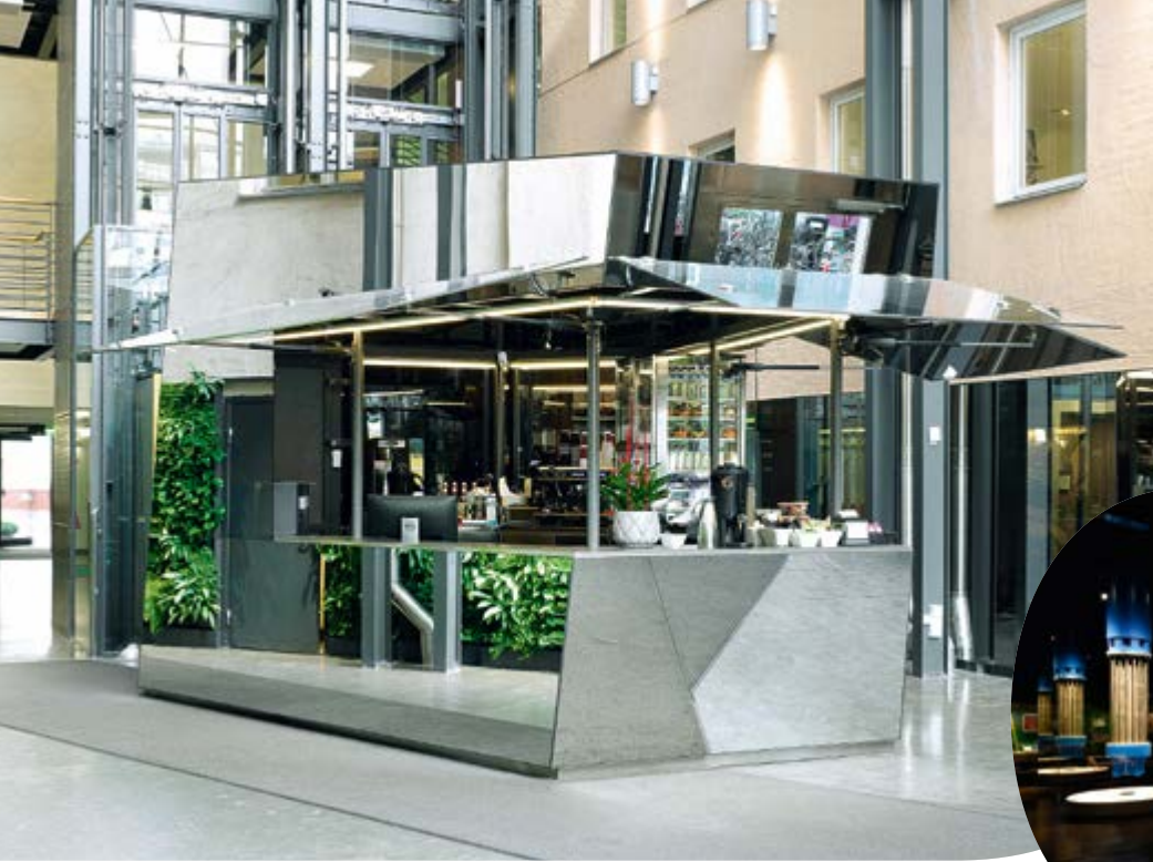
Glaskiosk, Stockholm, Schweden.