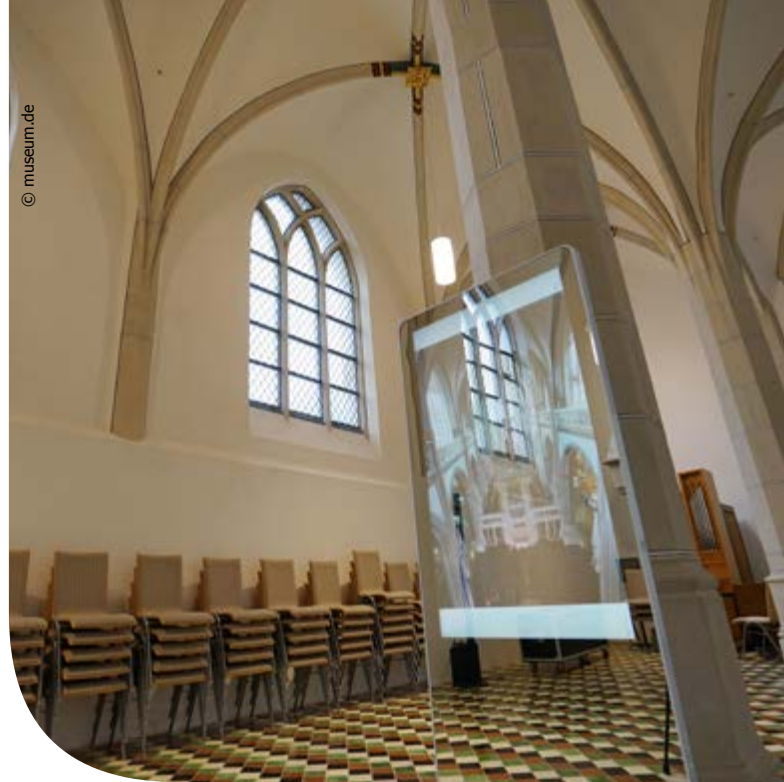
Informationsstele aus Pilkington MirroView™ mit Touch-Funktion im Xantener Dom St. Victor.

Mit Pilkington MirroView™ können Sie digitale Geräte anspruchsvoll und individuell in Ihre Galerie oder Ihre Ausstellung integrieren, denn die Beschichtung von Pilkington MirroView™ ist mit Touchscreen-Technologien kompatibel. Dabei überzeugt das Produkt durch eine besonders widerstandsfähige, farbneutrale und reflektierende Beschichtung.