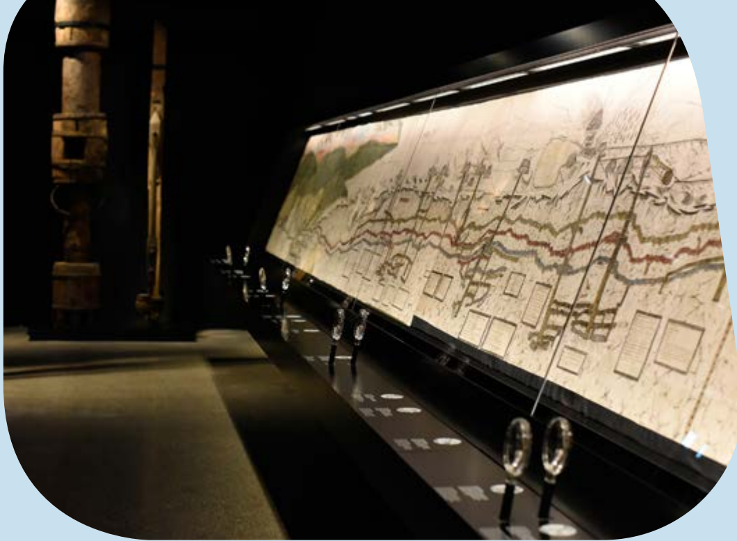
Titelfotos: oben links: Palazzo Te, Italien; unten links: Deutsches Fußballmuseum, Dortmund; rechts: DDR Museum, Berlin.