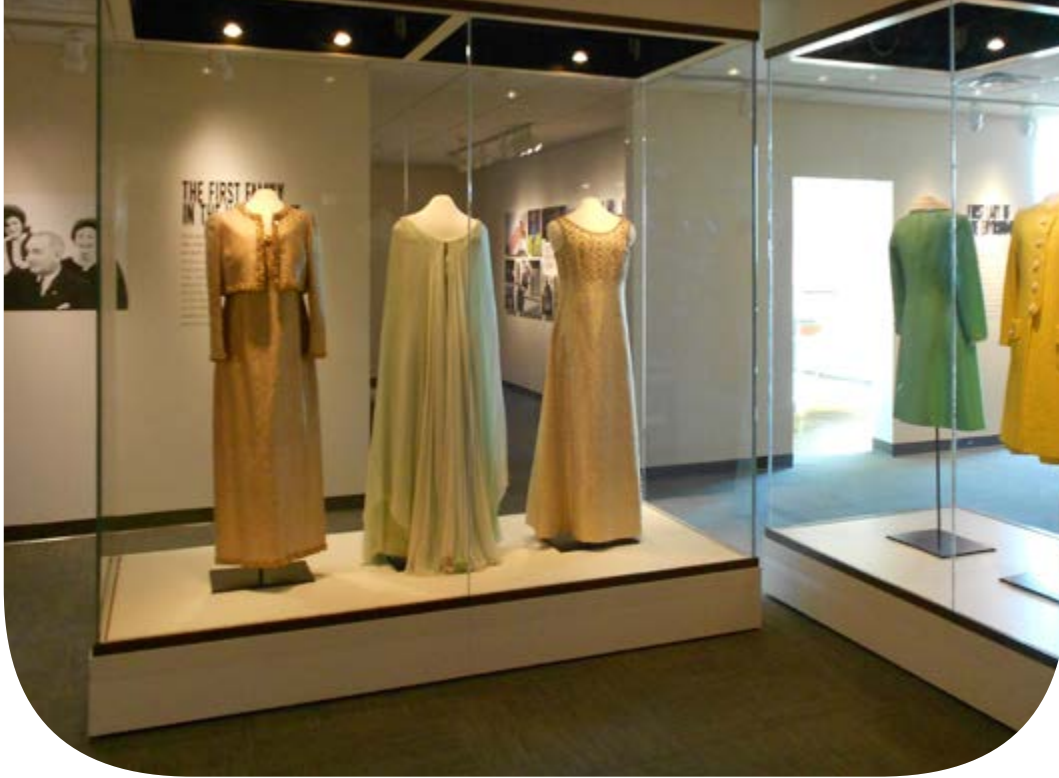
LBJ Presidential Library, Texas, USA.